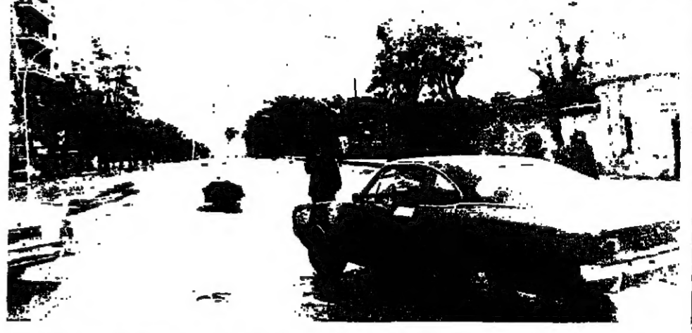
حركة المرور بين المنطقتين الشرقية والغربية من بيروت، كانت ضئيلة أمس، وخاصة عبر بوابة المتحف، وقد تولت قوات الردع، لأسباب أمنية، تحويل السيارات المتجهة من كورنيش المزرعة نحو المتحف، إلى شوارع فرعية كما يبدو في الصورة أعلاه.